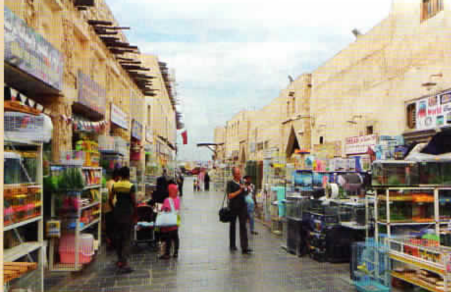
Pouliční tradiční ptačí trh.

Oč méně známá turistům, o to více je tato země známá televizním divákům celého světa díky slavné místní soukromé televizi Al Jazeera. Tato nej sledovanější arabská satelitní televize na světě, nazývaná též „arabská CNN“, byla jedním z hybatelů „arabské revoluce“, protože její zpravodajství